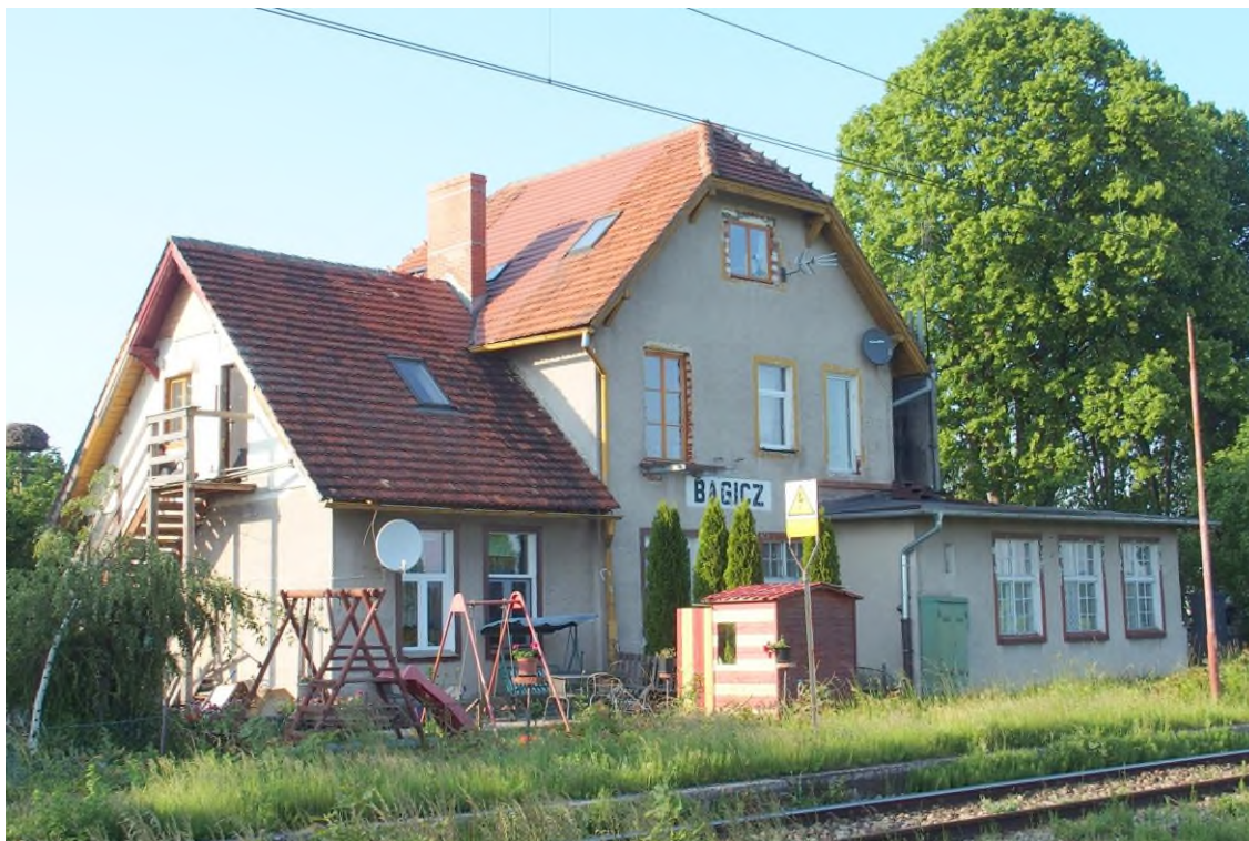
Widok budynku od południowego - zachodu

8. Fotografia z opisem wskazującym orientację albo mapa z zaznaczonym stanowiskiem archeologicznym