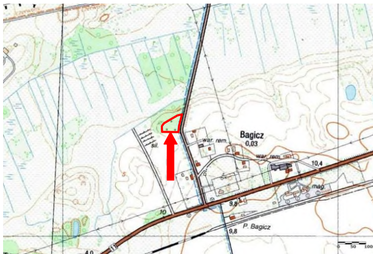
Mapa z lokalizacją obiektu