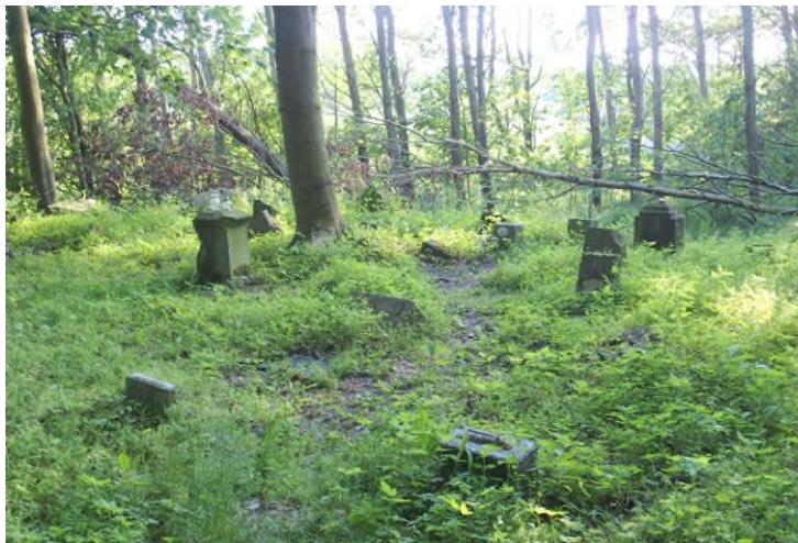
Widok od północnego - wschodu