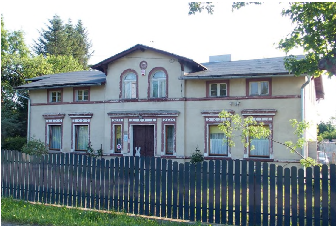
Widok budynku od północnego - wschodu

8. Fotografia z opisem wskazującym orientację albo mapa z zaznaczonym stanowiskiem archeologicznym