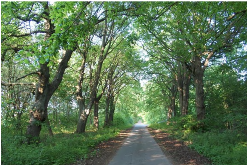
Widok od południowego - zachodu

8. Fotografia z opisem wskazującym orientację albo mapa z zaznaczonym stanowiskiem archeologicznym