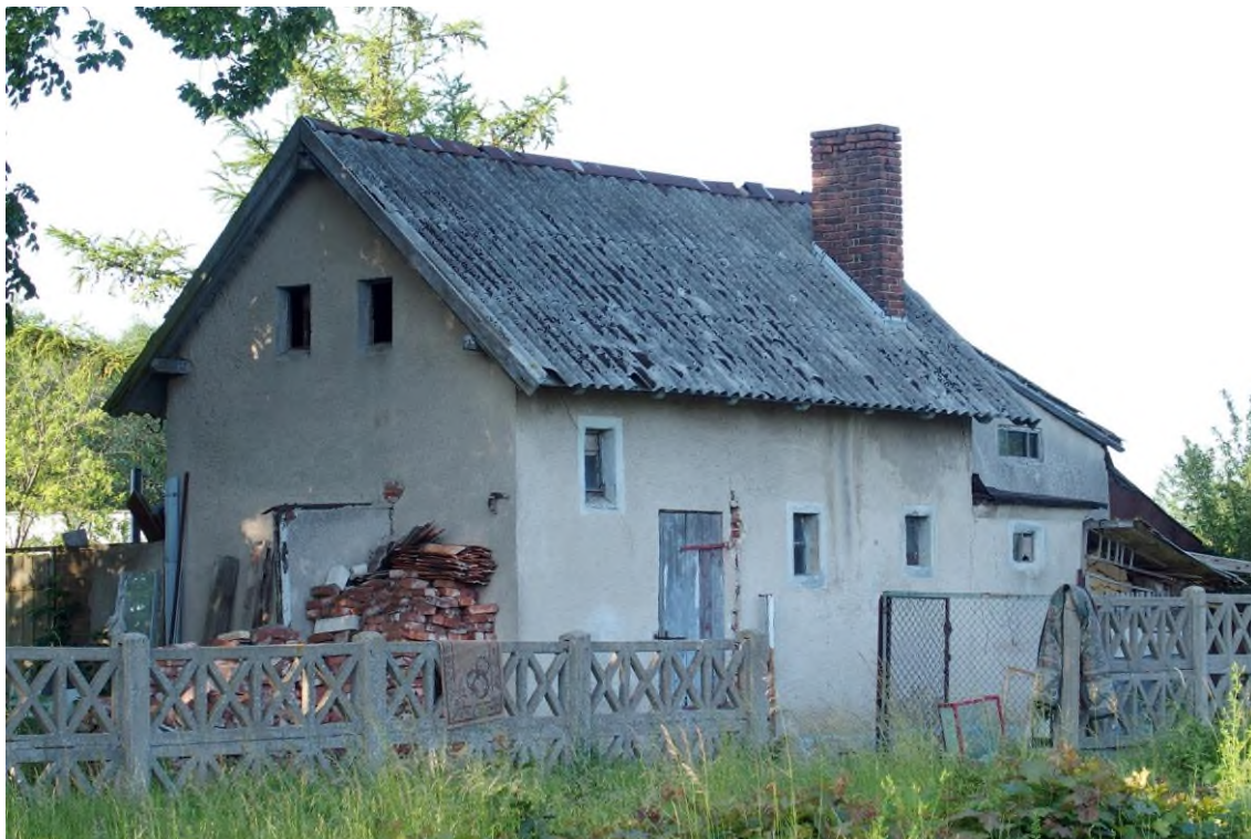
Widok budynku od południowego - zachodu

8. Fotografia z opisem wskazującym orientację albo mapa z zaznaczonym stanowiskiem archeologicznym