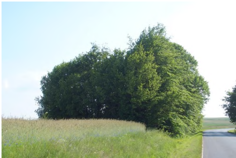
Widok od północnego - wschodu

8. Fotografia z opisem wskazującym orientację albo mapa z zaznaczonym stanowiskiem archeologicznym