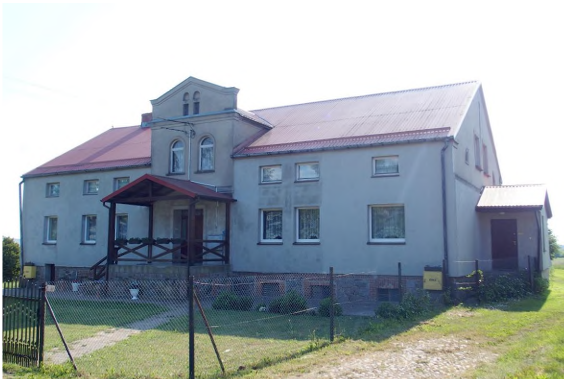
Widok budynku od północnego - wschodu

8. Fotografia z opisem wskazującym orientację albo mapa z zaznaczonym stanowiskiem archeologicznym