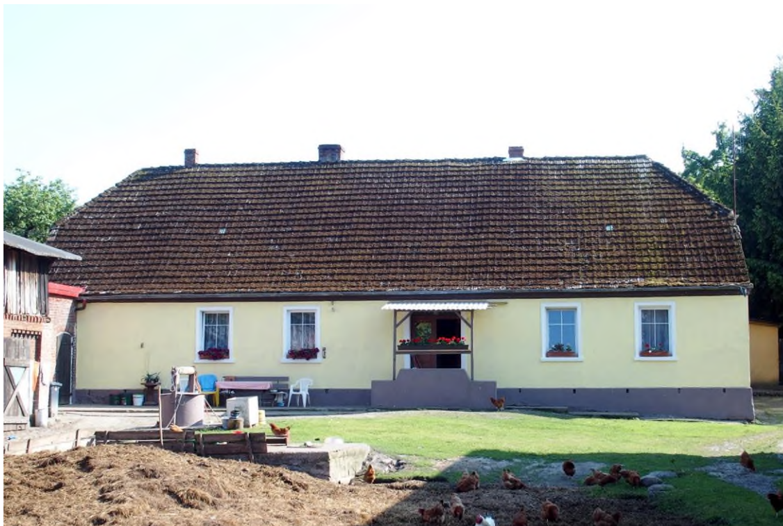
Widok budynku od północy

8. Fotografia z opisem wskazującym orientację albo mapa z zaznaczonym stanowiskiem archeologicznym