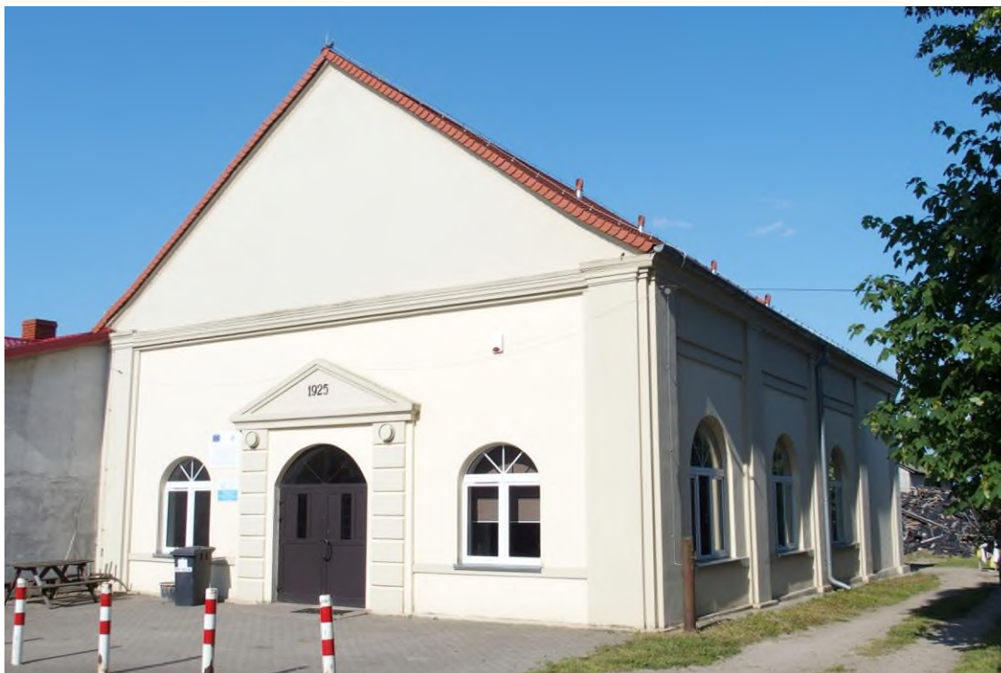
Widok budynku od południowego - zachodu

8. Fotografia z opisem wskazującym orientację albo mapa z zaznaczonym stanowiskiem archeologicznym