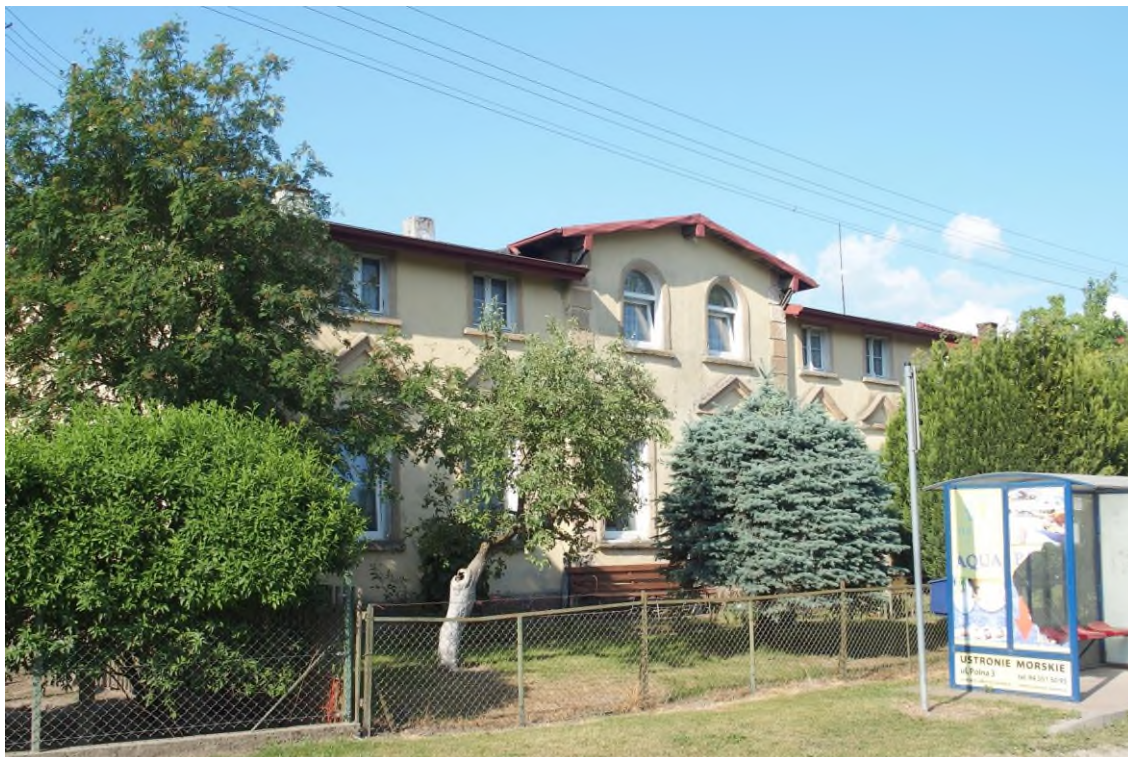
Widok budynku od południowego - zachodu

8. Fotografia z opisem wskazującym orientację albo mapa z zaznaczonym stanowiskiem archeologicznym