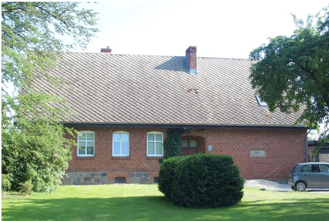
Widok budynku od północy

8. Fotografia z opisem wskazującym orientację albo mapa z zaznaczonym stanowiskiem archeologicznym