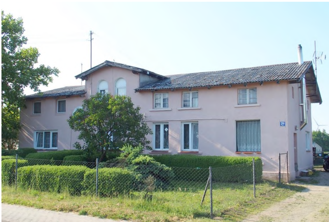
Widok budynku od południowego - wschodu

8. Fotografia z opisem wskazującym orientację albo mapa z zaznaczonym stanowiskiem archeologicznym