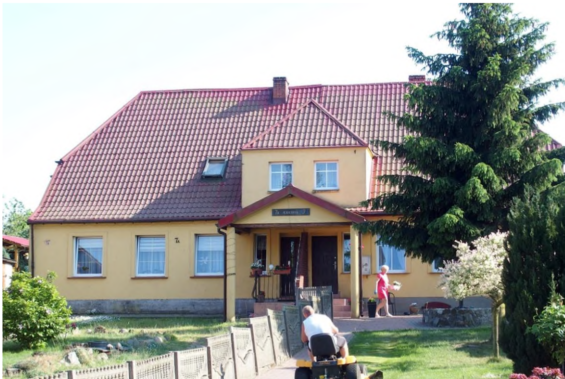
Widok budynku od północy

8. Fotografia z opisem wskazującym orientację albo mapa z zaznaczonym stanowiskiem archeologicznym