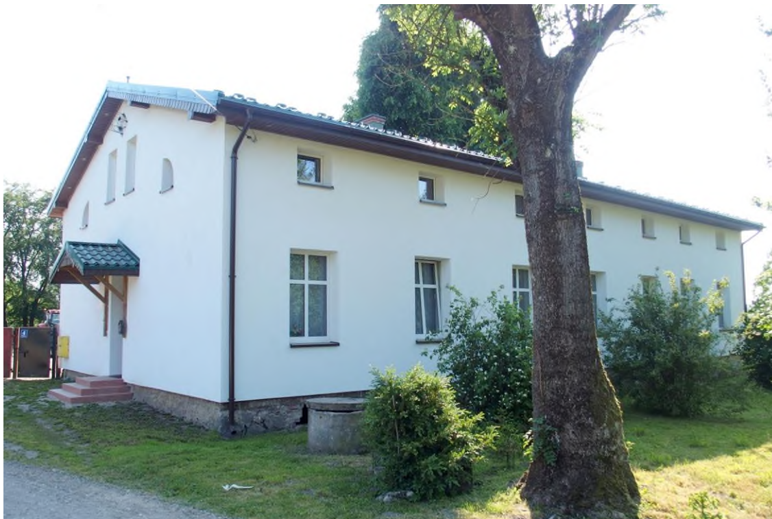
Widok budynku od północnego - wschodu

8. Fotografia z opisem wskazującym orientację albo mapa z zaznaczonym stanowiskiem archeologicznym