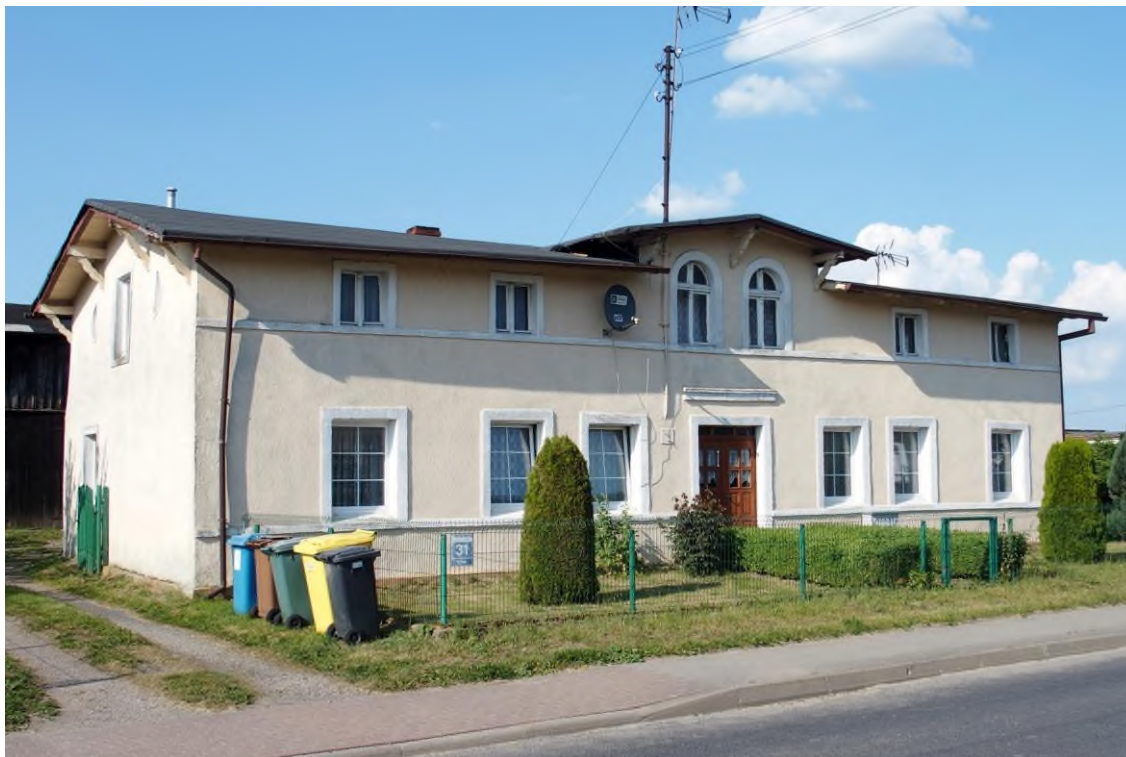
Widok budynku od południowego - zachodu

8. Fotografia z opisem wskazującym orientację albo mapa z zaznaczonym stanowiskiem archeologicznym