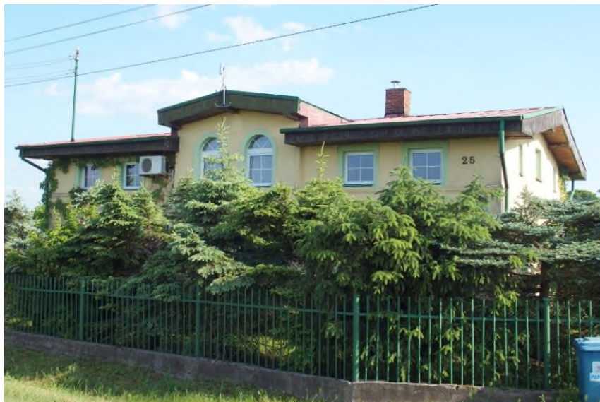
Widok budynku od północnego - zachodu

8. Fotografia z opisem wskazującym orientację albo mapa z zaznaczonym stanowiskiem archeologicznym