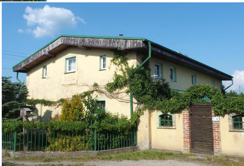
Widok budynku od południowego - zachodu