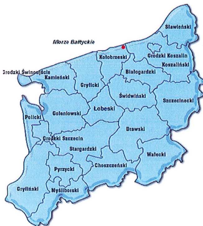
Rys. 2 mapa położenia Gminy Ustronie Morskie w Województwie

Odległości od wybranych miast wynoszą odpowiednio: od Szczecin – ok. 157 km, od Karlino – ok. 41 km oraz od Białogard – ok. 50 km.