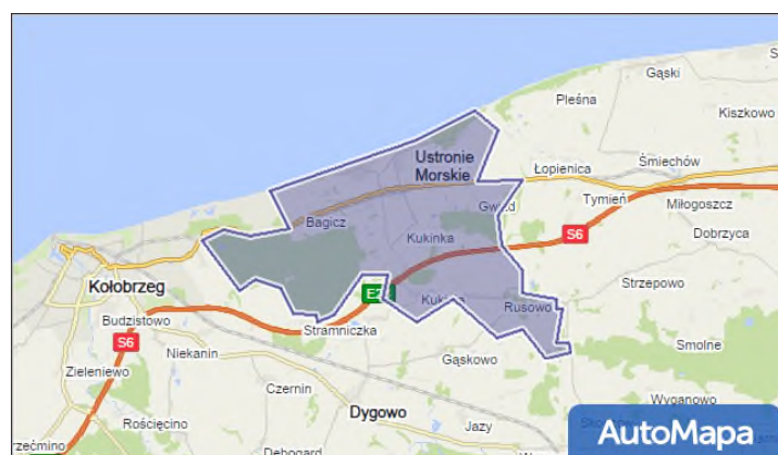
Rysunek 1 Położenie Gminy Ustronie Morskie