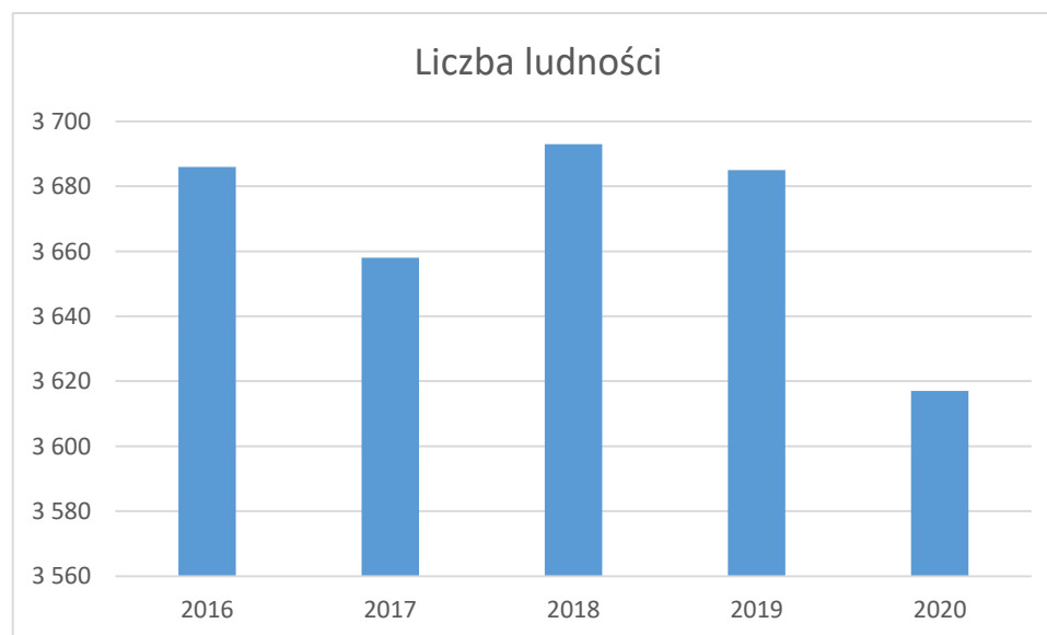
Rysunek 2 Zmiana liczby ludności na terenie Gminy Ustronie Morskie

Zmianę liczby ludności na terenie gminy przedstawiono na rysunku poniżej: