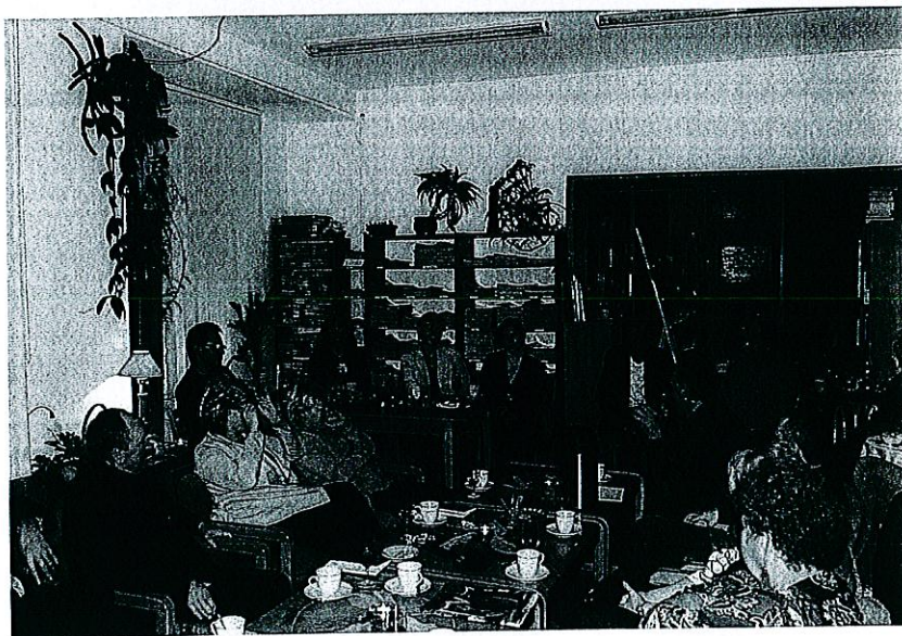
Zdjęcie nr 6. Listopadowe spotkania z poezją