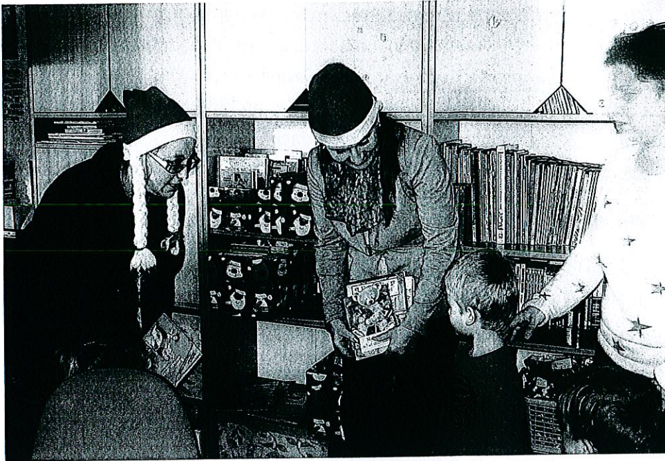
Zdjęcie nr 7. „Zaczytani” w kołobrzesckim szpitalu

Od 13 lat biblioteka bardzo aktywnie współpracuje z ustroniskim sztabem Wielkiej Orkiestry Świątecznej Pomocy. Corocznie w pomieszczeniach biblioteki odbywa się liczenie pieniędzy. W bibliotece ustroniskiej bariery architektoniczne uniemożliwiają korzystanie z niej osobom niepełnosprawnym. Z myślą o takich czytelnikach biblioteka współpracuje z Klubem Wolontariusza w Ustroniu Morskim przy dostarczaniu książek.