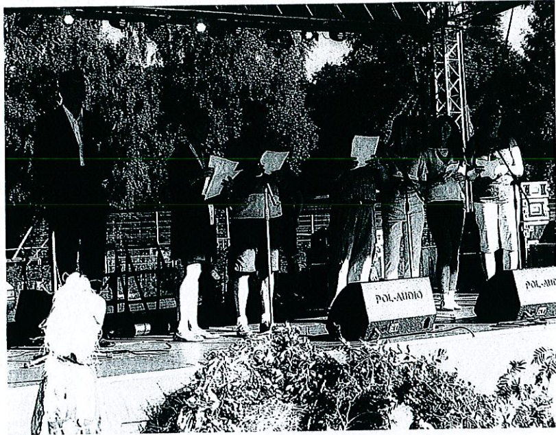
Zdjęcie nr 5. Dożynki – czytanie „Zemsty”