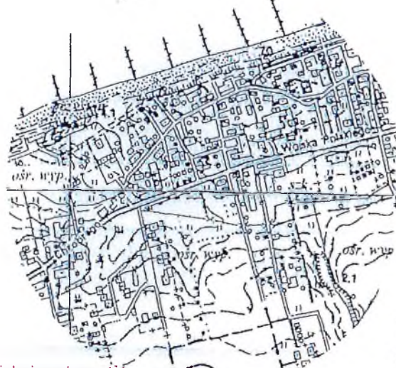
Wykaz zmian gruntowych