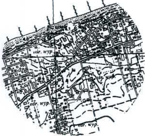
szkic orientacyjny skala 1:10000